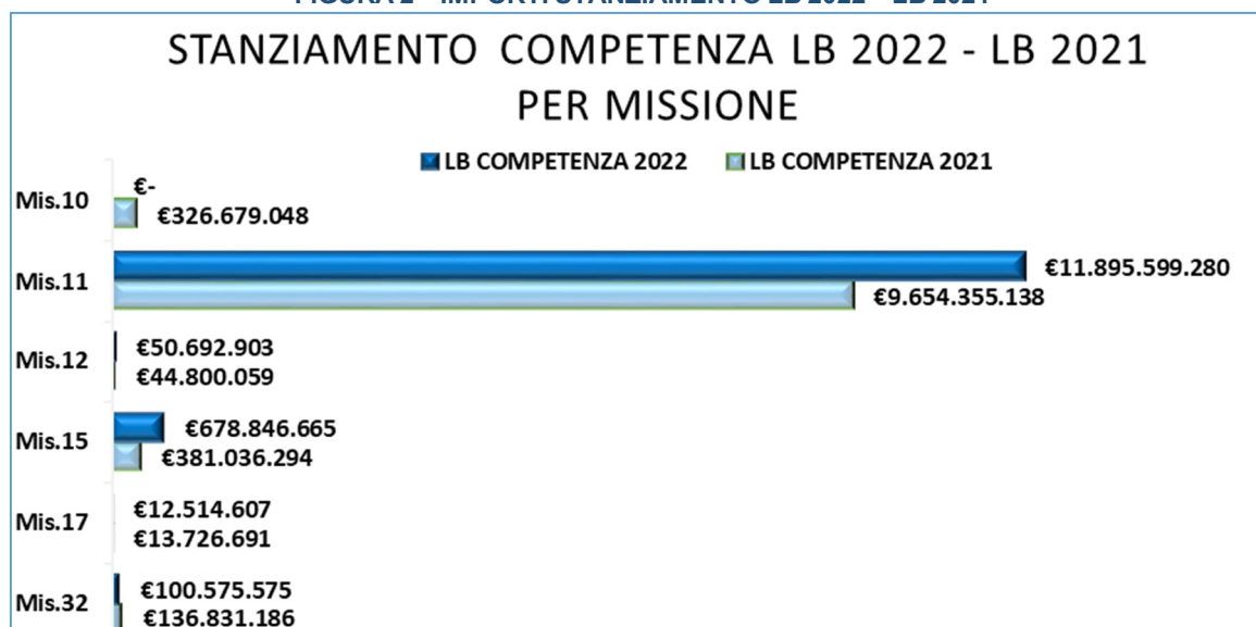
FIGURA 2 – IMPORTI STANZIAMENTO LB 2022 – LB 2021

FONTE: Importi da Legge di Bilancio 2022 e Legge di Bilancio 2021(stanziamenti di competenza)