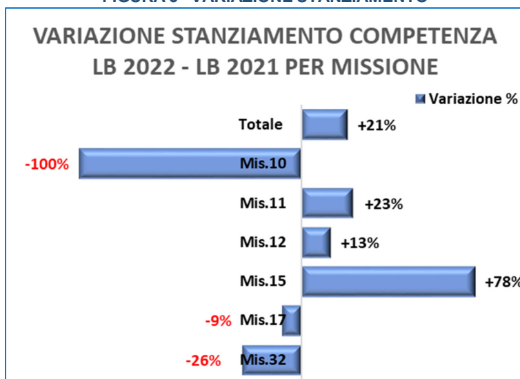
FIGURA 3 –VARIAZIONE STANZIAMENTO