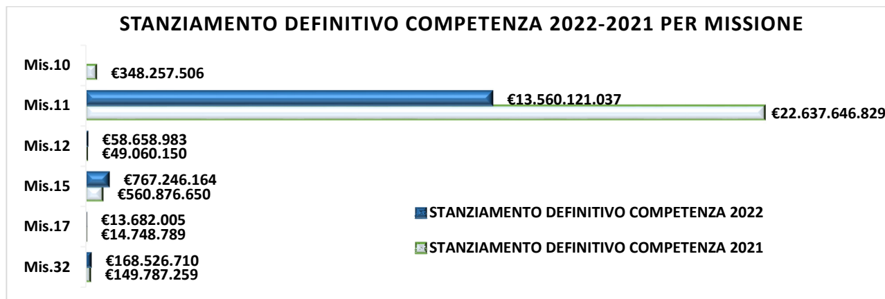
FIGURA 1 – IMPORTI STANZIAMENTO DEFINITIVI C/COMPETENZA RENDICONTO 2022 – 2021 PER MISSIONE

Per effetto della riorganizzazione del Ministero e del passaggio delle Direzioni dell'Energia al MITE le risorse finanziarie si sono ridotte del 100% per la Missione 010 - Energia e diversificazione delle fonti energetiche mentre la Missione 011 - Competitività e sviluppo delle imprese registra il maggior decremento (-40,10%) di stanziamenti definitivi in conto competenza rispetto all'anno 2021, come evidenziato nella FIGURA 1 e 2.